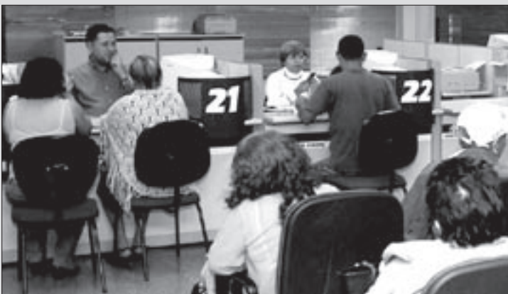
Pedidos de aposentadoria e salário-família devem ser requeridos diretamente nas agências do INSS

MINISTÉRIO DA PREVIDÊNCIA E ASSISTÊNCIA SOCIAL