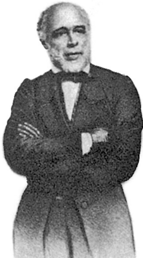
Francisco Jê Acaiaba de Montezuma