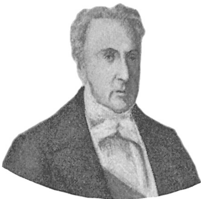
Marquês de Paranaguá