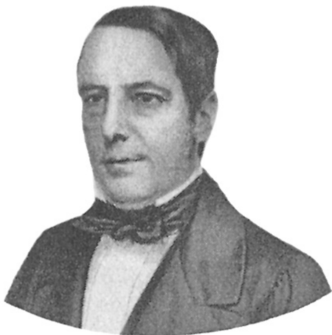
Nabuco de Araújo