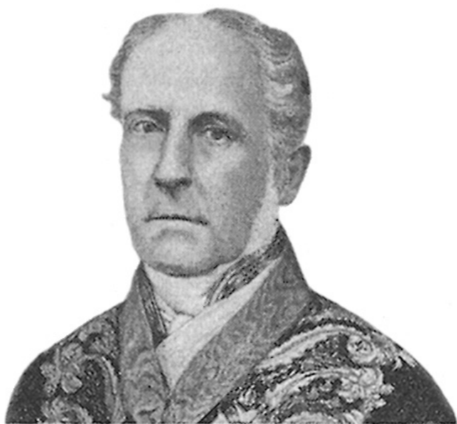
Marquês de Abrantes