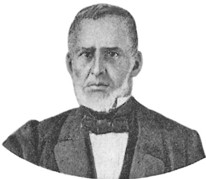
Visconde de Abaeté