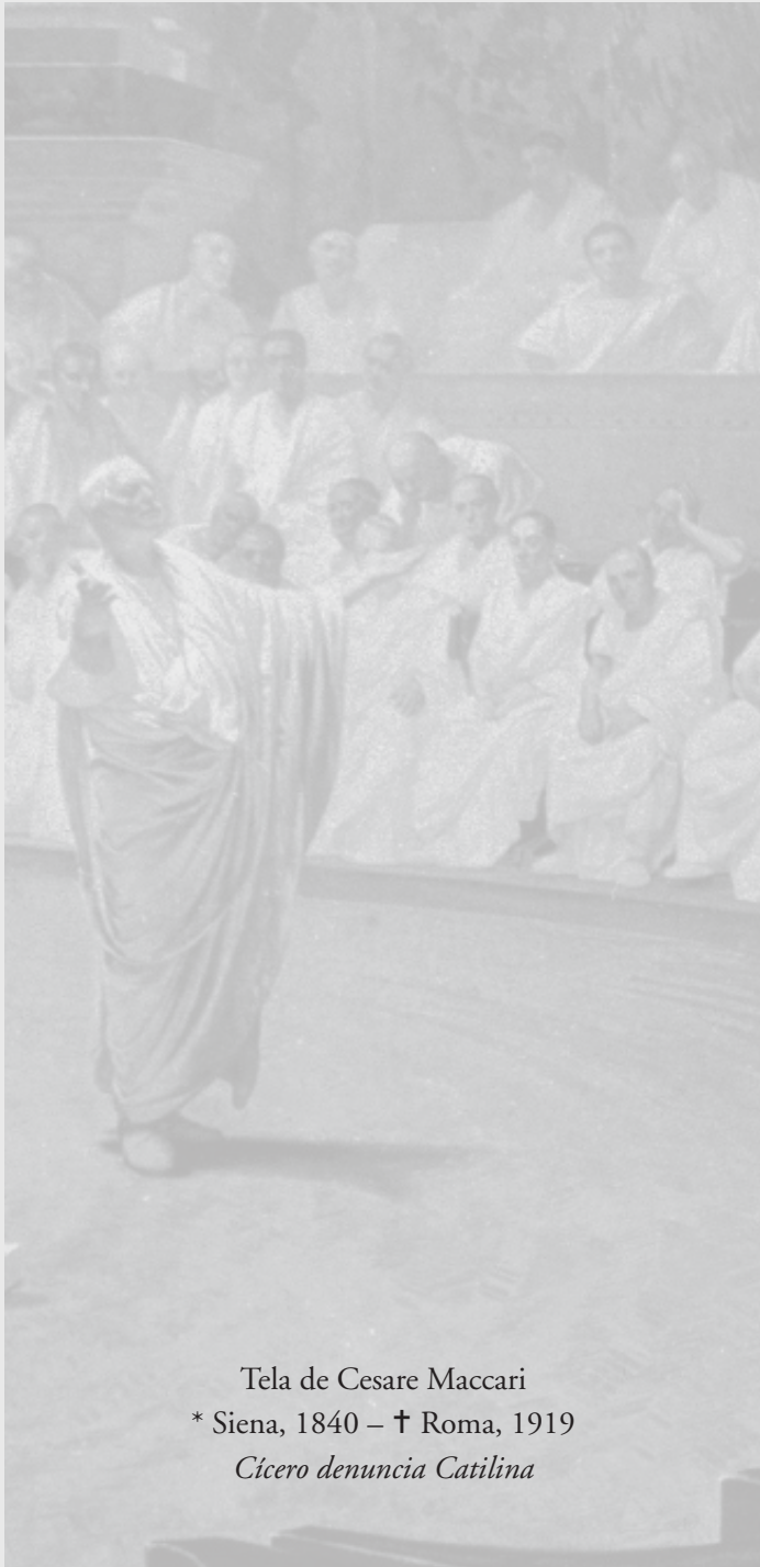
Tela de Cesare Maccari * Siena, 1840 – † Roma, 1919 Cicero denuncia Catilina