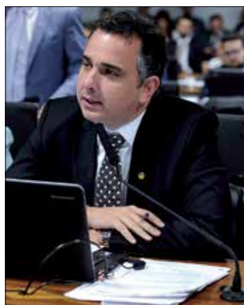
Relator, Rodrigo Pacheco é favorável à aprovação da proposta

A proposta, aprovada também pela Comissão de Assuntos Econômicos (CAE), recebeu parecer favorável do relator na CCJ, senador Rodrigo Pacheco (DEM-MG). Segundo Pacheco, o projeto restabelece a segurança jurídica para empresas que aderiram ao Refis na esperança de poder negociar débitos com a