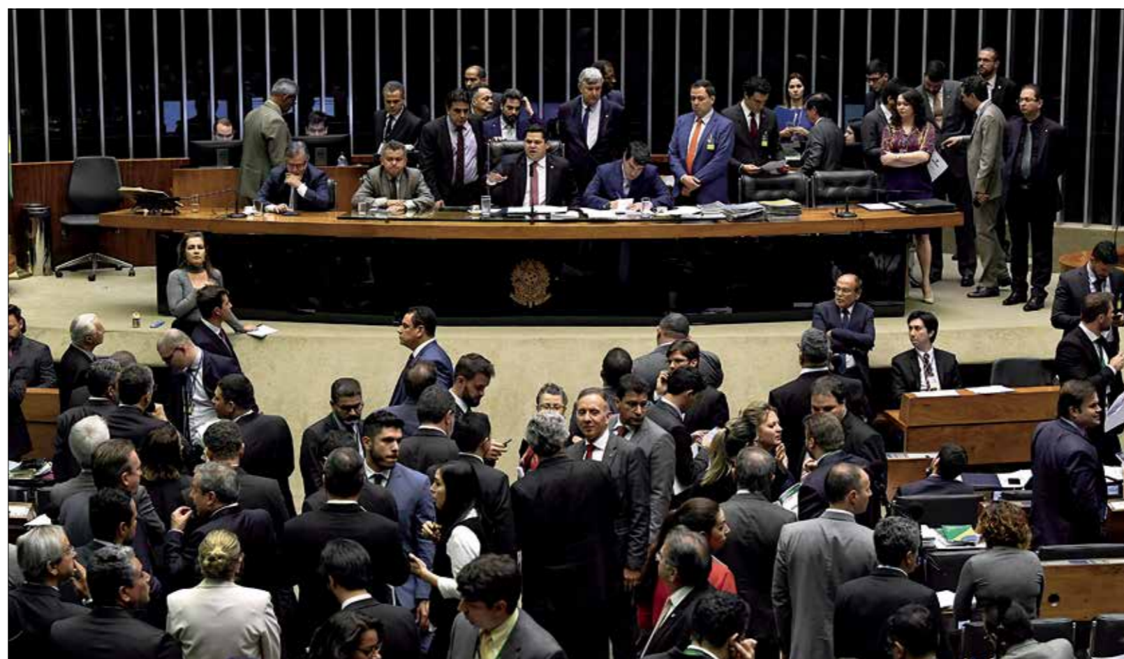
O presidente do Senado, Davi Alcolumbre (C), comandou a sessão, que abriu caminho para análise do projeto que autoriza o governo a vender títulos públicos

Foi vetado o artigo que previa que empregados da Companhia Brasileira de Trens Urbanos (CBTU) e do Metrô de Porto Alegre (Trensurb) teriam os mesmos salários e aposentadorias dos servidores da empresa pública Valec Engenharia, Construções e Ferrovias. Atualmente, a paridade existe apenas para funcionários da extinta Rede Ferroviária Federal (RFFSA) transferidos para os quadros da Valec. A justificativa do governo