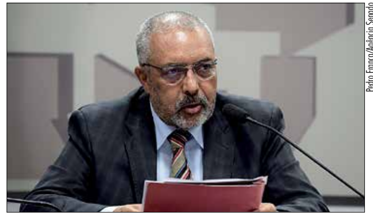
Relator, Paim avaliou que duas das emendas abrandavam a punição

O PL 2.479/2019 segue para análise pelo Plenário, em regime de urgência.