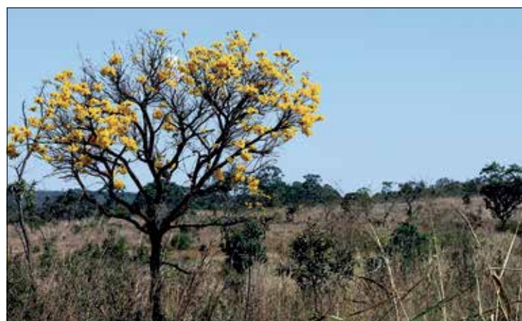
Gabriel Lohur/Agência Brasília

Em debate na Comissão de Meio Ambiente, especialistas apresentaram números relacionados aos biomas brasileiros e reclamaram da política ambiental do governo. 2