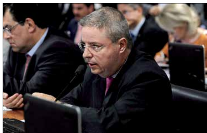
Substitutivo de Antonio Anastasia passará por turno suplementar

Anastasia também acolheu sugestão de Rodrigo Pacheco (DEM-MG) para aperfeiçoar as definições dos crimes de gestão fraudulenta e temerária na Lei dos Crimes Contra o Sistema Financeiro Nacional. O relator também estendeu a responsabilização penal a atos de gestão fraudulenta e temerária cometidos no RPPS, regime previdenciário aplicado aos servidores públicos efetivos.