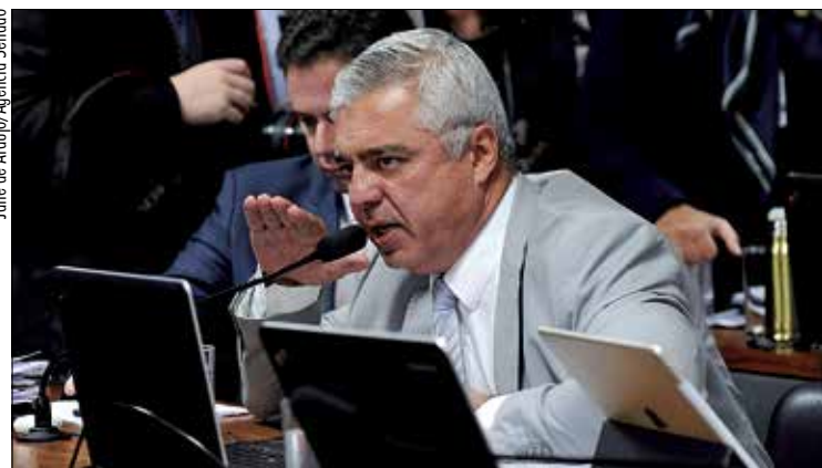
Para Major Olímpio, cadastro é importante para o combate ao crime

O relator observou que a criação do cadastro estava entre as sugestões da CPI da Pedofilia, encerrada em 2010.