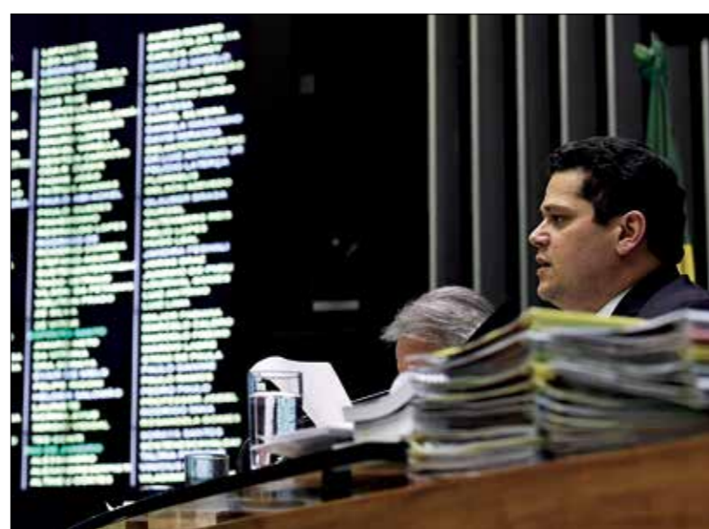
Davi diz que acordo de líderes permitiu deixar destaques para a semana que vem

O primeiro veto atinge um projeto do Senado que isenta de reavaliação da perícia médica do INSS pessoa com HIV aposentada por invalidez (PLS 188/2017). Atualmente os aposentados por