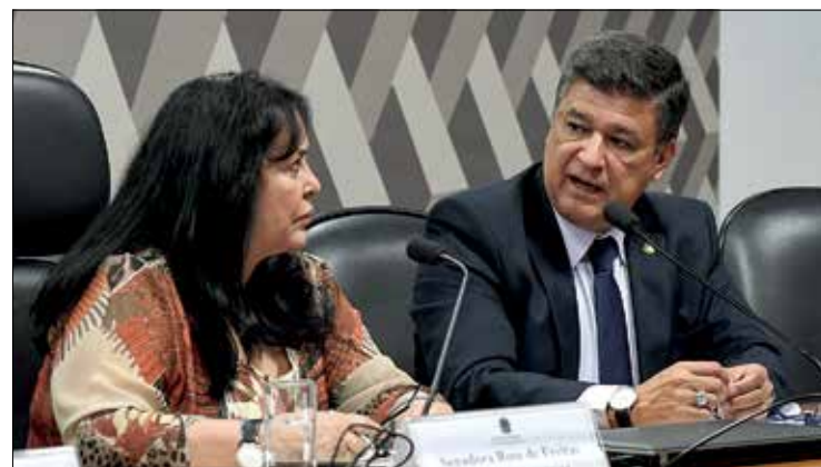
Rose de Freitas e Carlos Viana, presidente e relator da CPI de Brumadinho

para que nós não assistamos mais ao que vimos em Minas Gerais pela segunda vez — disse o senador.