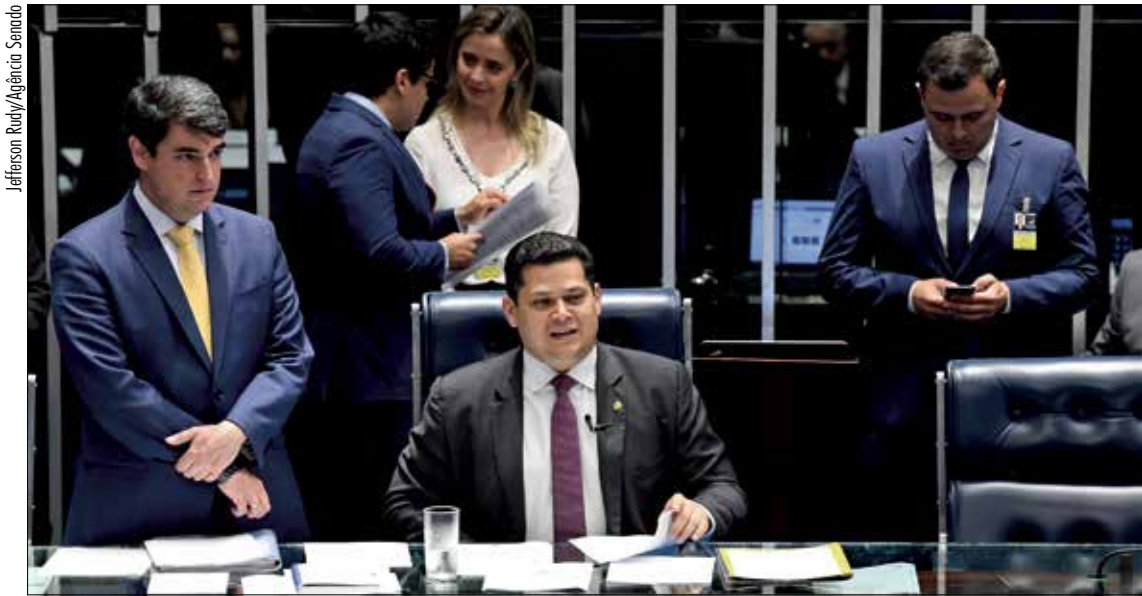
Davi informou ter acertado com Rodrigo Maia a votação pela Câmara de PEC que altera a tramitação de MPs