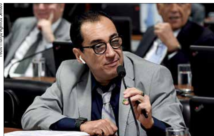
Para Kajuru, modelo de rotulagem no Brasil não informa o consumidor

Romário promoveu ajustes de redação no texto, que segue para votação final na Comissão de Transparência, Fiscalização e Controle e Defesa do Consumidor (CTFC). Se o projeto for aprovado, os produtos fabricados até o início da vigência da lei poderão ser comercializados até o final do prazo de validade.