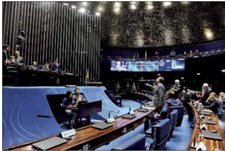
Plenário do Senado durante sessão em que foi aprovada a proposta

Entre as intervenções da Câmara aprovadas estão a inclusão da Agência Nacional de Mineração (ANM) no rol dos órgãos atingidos pela lei e a extensão de algumas normas para o Conselho Administra-