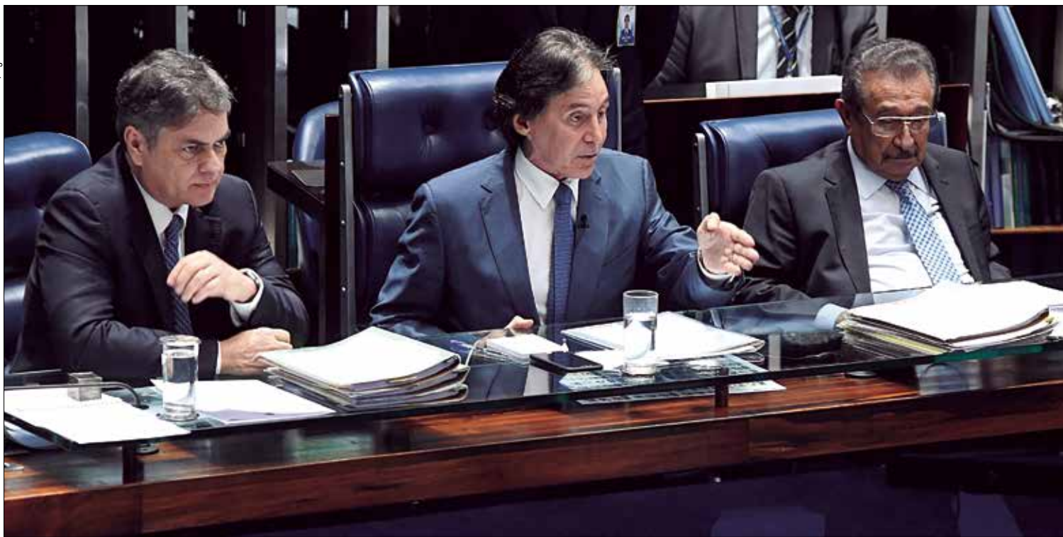
Entre Cássio Cunha Lima e José Maranhão, Eunício Oliveira comanda a sessão plenária que manteve os dados de 2018 para o cálculo de repasse do FPM até 2020

O Plenário do Senado aprovou ontem, com 49 votos favoráveis e 8 contrários, a proposta que fixa os coeficientes de divisão do Fundo de Participação dos Municípios até 2020. O texto segue para sanção.