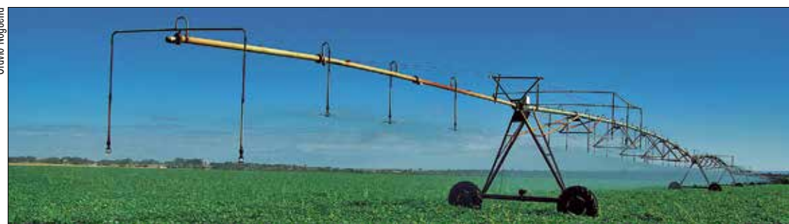
O prazo para governo encaminhar o plano agrícola ao Congresso coincide com o limite para a entrega da LDO

— Acho esse projeto muito inteligente e interessante, pois abre a possibilidade de produtores que têm dificuldade de subsistência poderiam negociar a tarifa mais proveitosa para produzir no fim de semana, e não só à noite, como é hoje — disse Rapp.