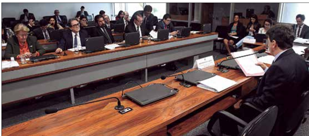
Plenário da comissão durante a análise do texto que fixa prazo para o Executivo apresentar o plano ao Congresso

O prazo proposto é o mesmo previsto para o Executivo encaminhar a Lei de Diretrizes Orçamentárias. 6