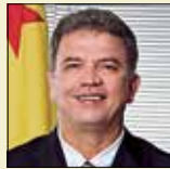
PRIMEIRO-SECRETÁRIO Sérgio Petecão (PSD-AC)