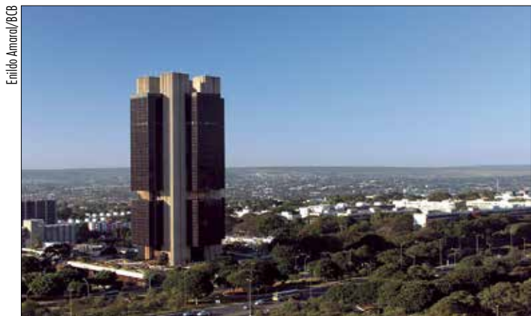
Indicação para comandar Banco Central deve ser lida no Plenário em breve

A proposição ainda precisa ser direcionada para análise nas comissões do Senado pertinentes ao tema.