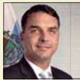
TERCEIRO-SECRETÁRIO Flávio Bolsonaro (PSL-RJ)