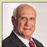
SEGUNDO-VICE-PRESIDENTE Lasier Martins (Pode-RS)