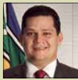
PRIMEIRO-VICE-PRESIDENTE Davi Alcolumbre (DEM-AP)