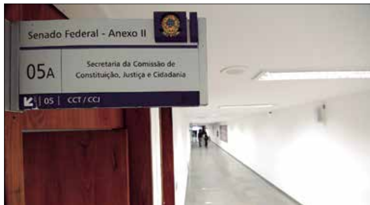
Comissão de Constituição e Justiça é uma das mais importantes da Casa

— Quem não estiver na Mesa será atendido nas comissões e nas relatorias que estão por vir.