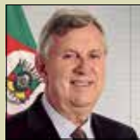
QUARTO-SECRETÁRIO Luis Carlos Heinze (PP-RS)