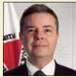
PRIMEIRO-VICE-PRESIDENTE Antonio Anastasia (PSDB-MG)