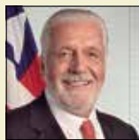
TERCEIRO-SUPLENTE Jaques Wagner (PT-BA)