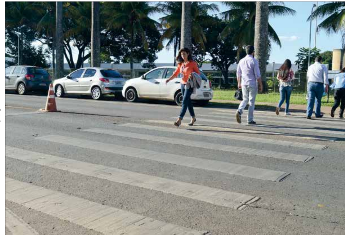
Pedestres têm prioridade para atravessar nas faixas em Brasília, mas falta de campanhas e imprudência têm elevado acidentes

A ação é simples: o pedestre para no começo da faixa e, ainda na calçada, estica o braço na horizontal, dando sinal de que pretende atravessar. Os motoristas entendem a mensagem