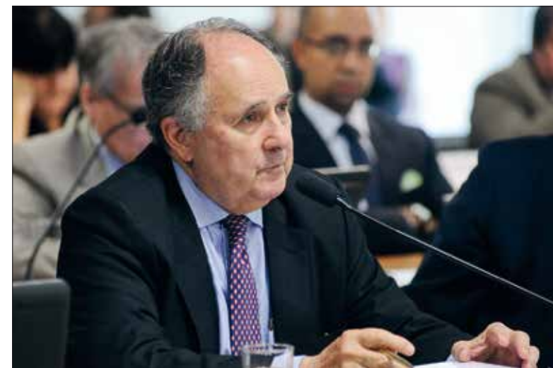
Para o senador Cristovam, diminuir a violência no trânsito depende de educação

A chave para a redução da mortalidade, diz o relatório, é garantir que os Estados-