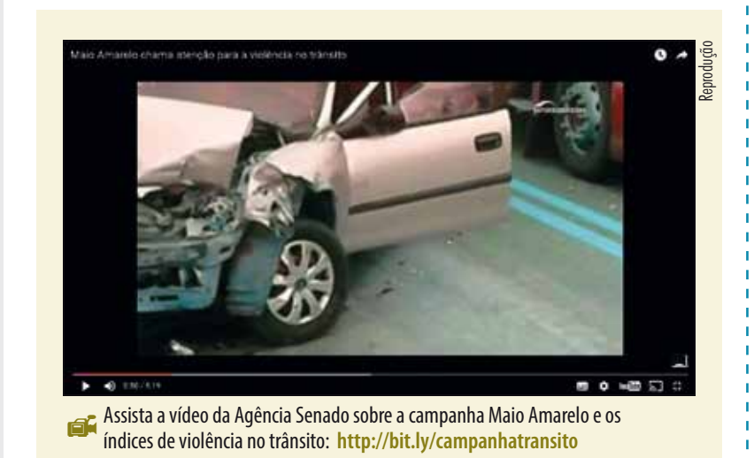
Assista a vídeo da Agência Senado sobre a campanha Maio Amarelo e os índices de violência no trânsito: http://bit.ly/campanhatransito

— É triste perceber que a segurança dos ciclistas depende da educação e da consciência daquele que é mais forte. Não é uma questão de potência ou de quem corre mais ou menos. É uma questão de respeito.