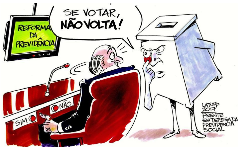
Figura 1 – Se votar, não volta!

Assim, pela lógica da ação coletiva, parlamentares com voto favorável a este tipo de reforma enfrentariam maior dificuldade de se reeleger, colhendo o “ônus” da reforma, mas não seu “bônus”. Este raciocínio é ilustrado pelo slogan da chamada “Frente Parlamentar Mista em Defesa da Previdência Social”, grupo contrário à reforma: “ Se votar, não volta! ”.