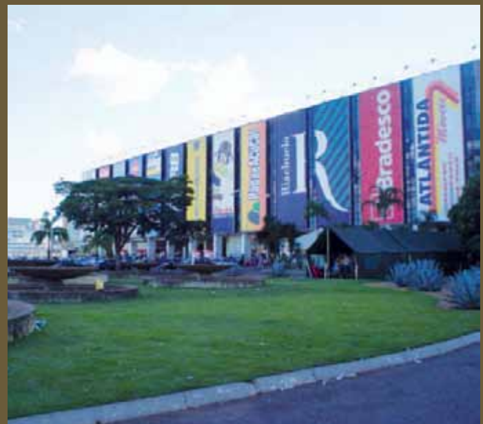
Conjunto Nacional, Brasília