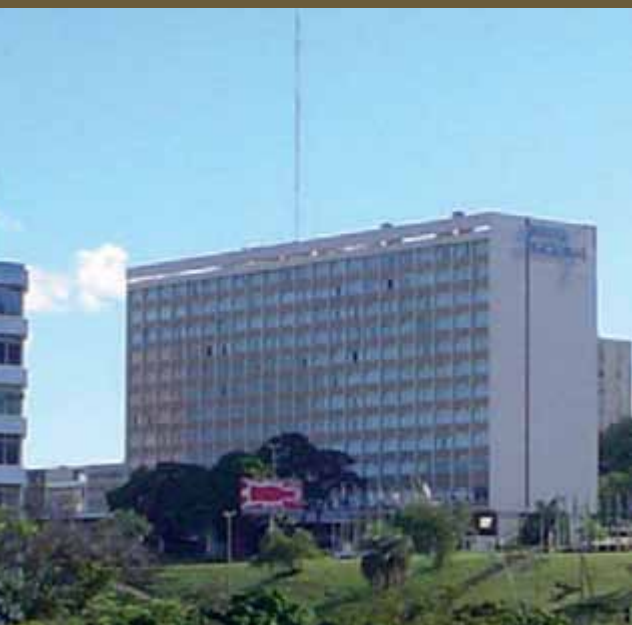
Hotel Nacional, Brasília

Enumeram-se ainda, entre outros, alguns projetos de sua autoria que viriam a ter forte presença na paisagem urbana de Brasília: o Palácio do Buriti e Anexo, o Hotel Nacional, o Conjunto Nacional, o Edifício Casa de São Paulo, o Jardim de Infância 21 de Abril, os Edifícios Ceará, Sônia e Presidente no Setor Comercial Sul, o Cine Karim da EQS 110/111, o Hospital Santa Lúcia (projeto inicial), o Edifício Central Brasília no Setor Bancário Norte, o Edifício Venâncio VI, o Carlton Hotel, a Fundação Ballet do Brasil, inúmeros blocos de apartamentos nas superquadras etc.