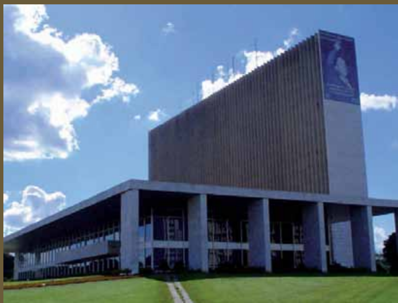
Palácio do Buriti, Brasília