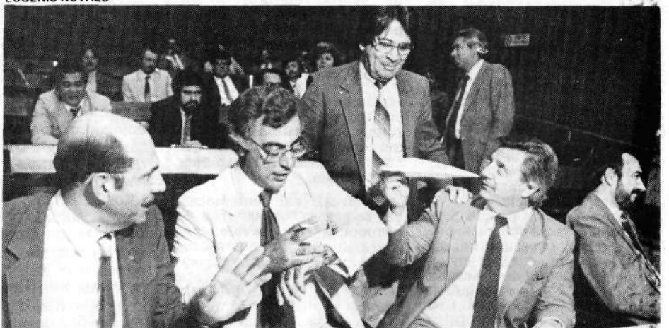
Na entrega das emendas, a descontração incluiu aviões de papel