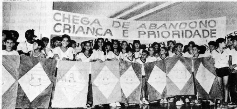
As crianças, mais uma vez, fizeram festa e pediram por seus direitos