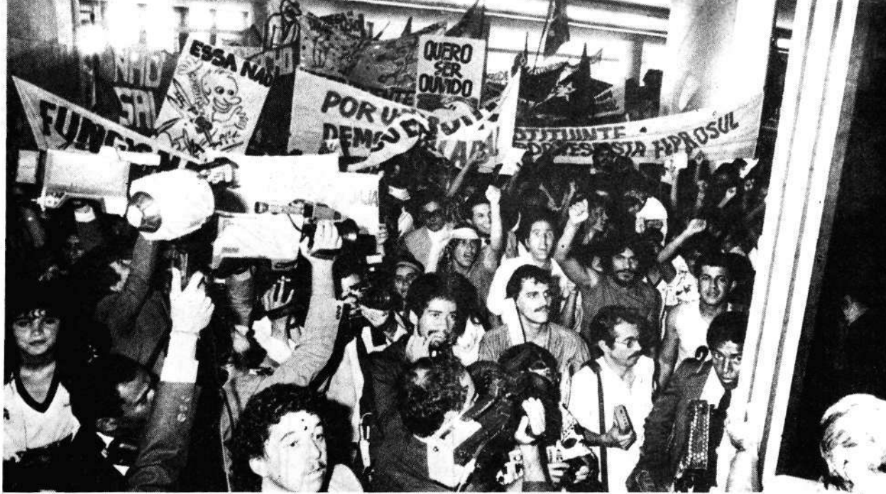
Na entrega das emendas populares, quase duas mil pessoas não deixaram Ulysses Guimarães falar