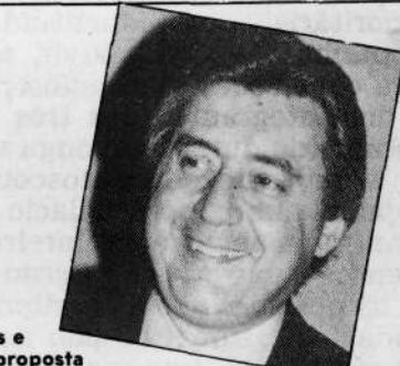
Covas e Afif: uma proposta para o acordo.

em que a demissão poderia ser anulada, como uma proteção mínima ao trabalhador, tendo em vista os empregados representantes das Comissões Internas de Prevenção de Acidentes, dos dirigentes sindicais e das gestantes.