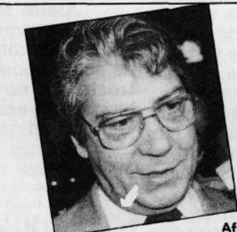
Afif: uma proposta para o acordo.

A proposta das esquerdas — apresentada por Domingos Leonelli (PMDB-BA), Luis Inácio Lula da Silva (PT-SP), Jorge Hage (PMDB-BA) e Brandão Monteiro (PDT-RJ) — não chegou a ser votada. Ela estabelecia como direito dos trabalhadores a "relação de emprego protegida contra despedida arbitrária ou sem justa causa, definida em lei, com nulidade do ato de demissão, e casos de indenização, sem prejuízo de outros direitos". As duas propostas são semelhantes, com a diferença que a das esquerdas prevê casos