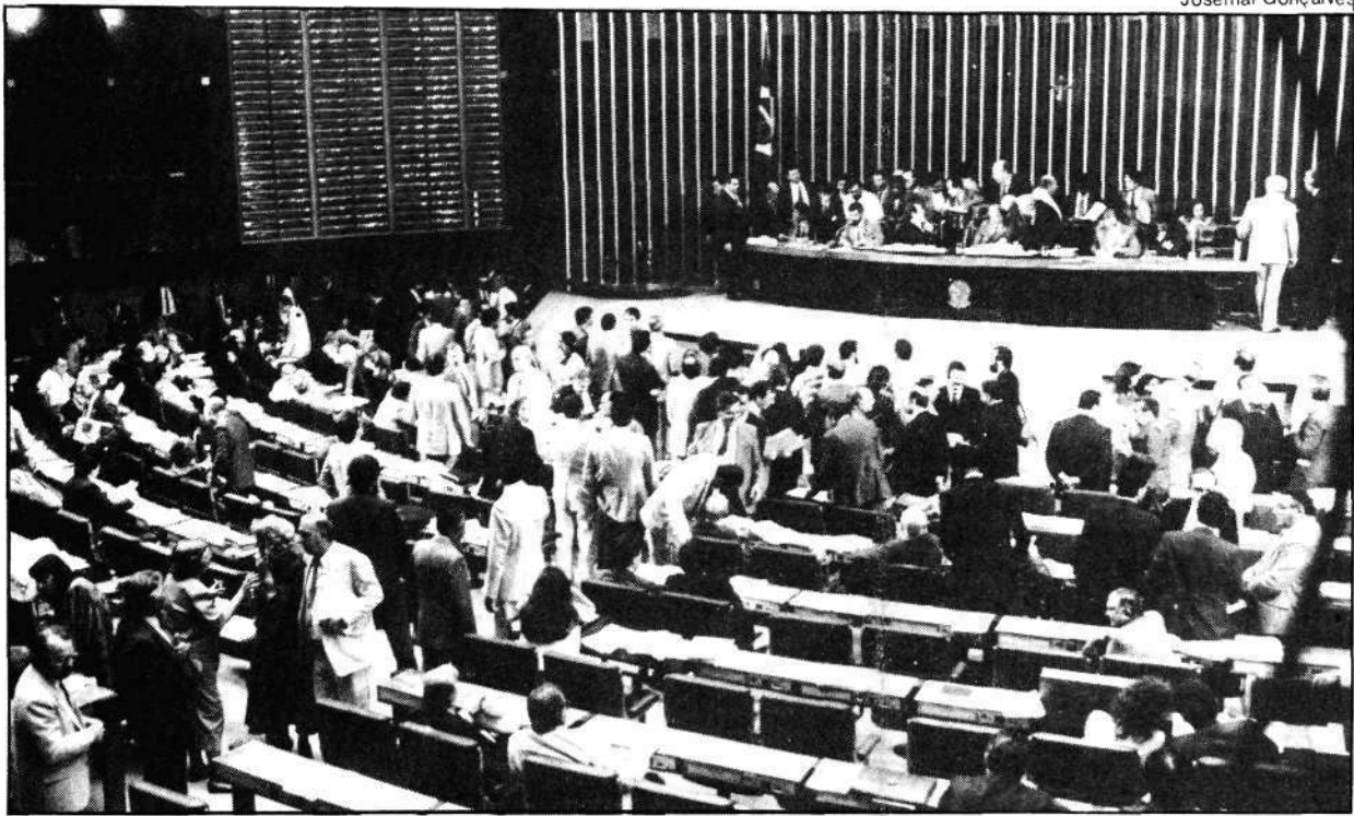
No plenário, parlamentares participam das chamadas nominais atrasando a votação das emendas