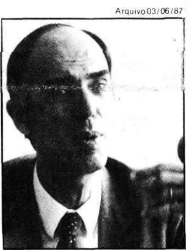
Senador critica «desgoverno»

Mas, o próprio deputado admite que a inversão poderá ser desnecessária, na medida em que, segundo ele, as votações em plenário têm tido agilidade não esperada. "Se este clima se mantiver, com a votação por entendimento, acho que a inversão poderá perder sua finalidade", explicou.