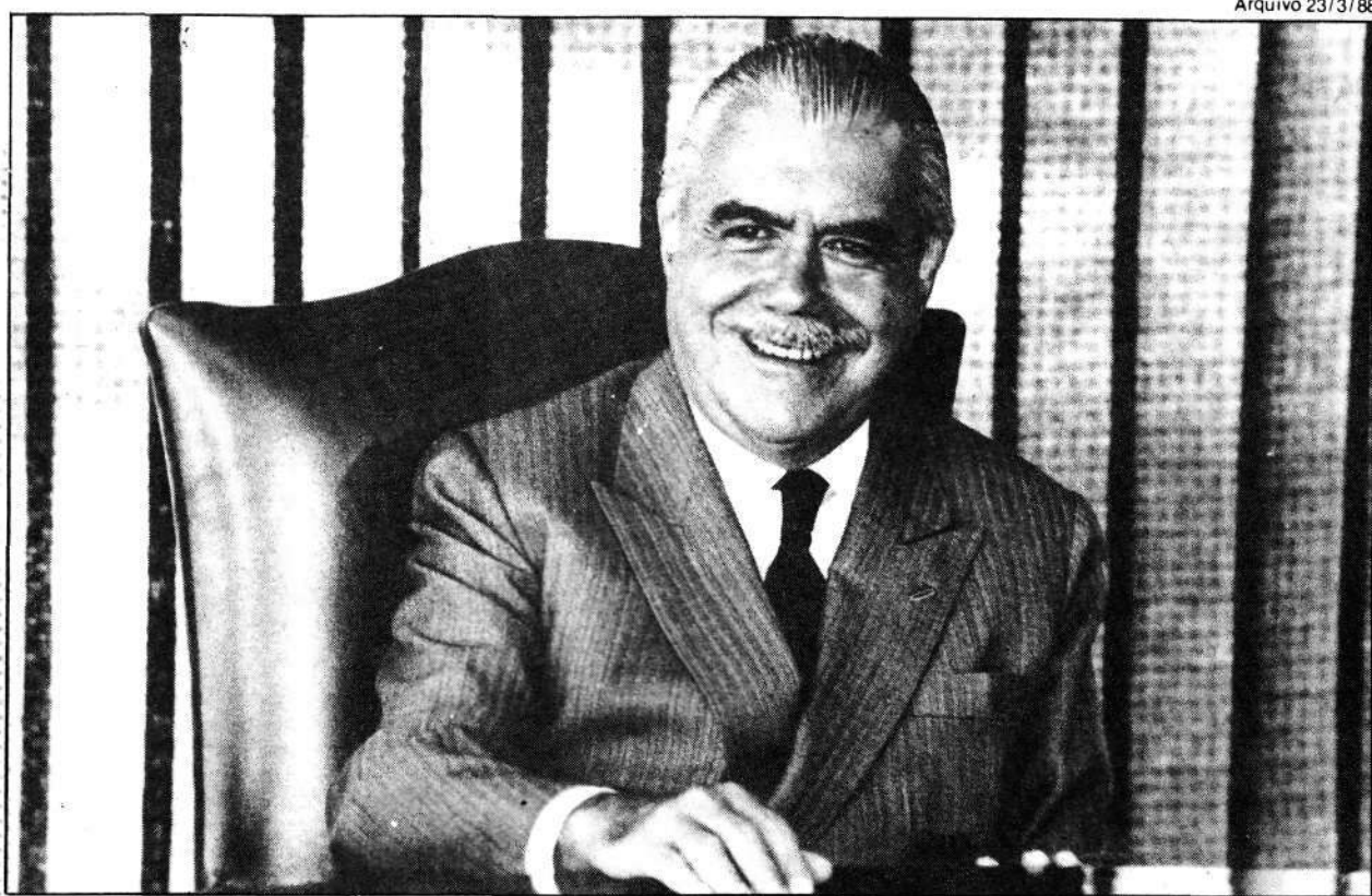
Sarney: cinco anos podem trazer desfecho dramático