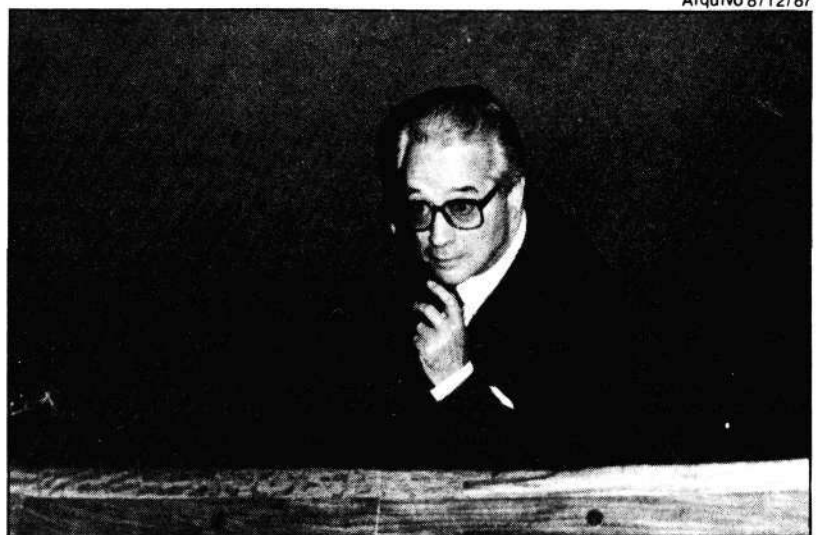
Lourenço: pressões e blefes por maior participação no poder

As bases estão reaglutinadas e é ingenuidade julgar que sejam bases "novas". O Governo se vale do apoio do mesmo PDS de sempre, dos mesmos conservadores do PMDB e do PTB e da grande maioria fisiológica do PFL. Reafirma-se a dominação no partido da tendência governista liderada por Antônio Carlos Magalhães, cuja "crescente liderança" entre os pefelistas, como se costuma detectar, não representa nenhum risco à liderança de Marco Maciel, já que ambos, até por peculiaridades regionais, não têm a menor condição de traçar caminhos opostos. Sem levar em conta as identidades doutrinares, a simples análise do quadro político jamais fará antever a hipótese de aliança de ACM com Waldir Pires, na Bahia, ou Marco Maciel com Miguel Arraes, em Pernambuco. Os caminhos pefelistas seguem, portanto, os mesmos rumos, o que faz as "ameaças" de José Lourenço caírem sempre no vazio.