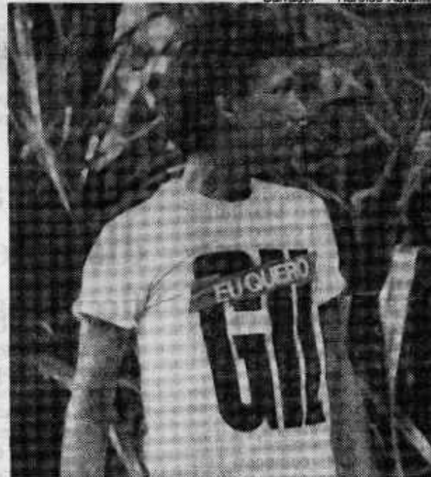
Na camiseta, o apelo eleitoral do cantor