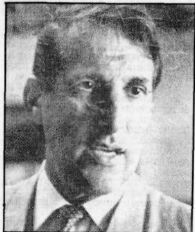
Quércia: fé no presidencialismo

No único compromisso público ontem, Orestes Quércia aproveitou para defender o presidencialismo durante uma visita à 17ª Feira de Mecânica Nacional, no Parque Anhembi.