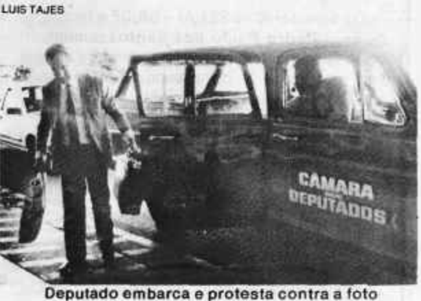
Deputado embarca e protesta contra a foto

Pelo menos durante seis dias Brasília não será a capital política do País. A maioria dos constituintes embarcou ontem mesmo para passar o carnaval em lugares mais animados, aproveitando o cancelamento das votações de hoje na Assembleia Nacional Constituinte. A cada cinco minutos chegavam um carro oficial transportando parlamentares que seguiam direto para a saída Vip do Aeroporto, evitando as longas filas nos balcões de embarque. Os constituintes chegavam dispostos a aproveitar o feriado longe do plenário