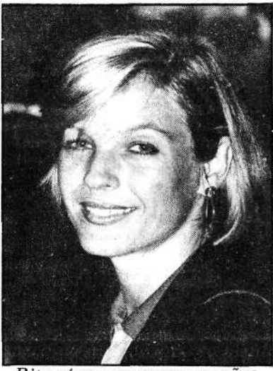
Rita só espera as convenções

Filho e os deputados Renan Calheiros e Geraldo Bulhões também estão dispostos a deixar o partido.