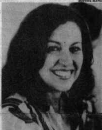
Márcia Kubistchek (PMDB-DF)

Como parceira ideológica de Moema e companheira de Rita, a deputada federal reeleita Bete Mendes (PMDB-SP), 37, traz no currículo sua participação na Vanguarda Popular Revolucionária (VPR) e as agruras dos militantes de esquerda na década de 70. Casada, Bete conquistou mais de 58 000 votos nas últimas eleições,