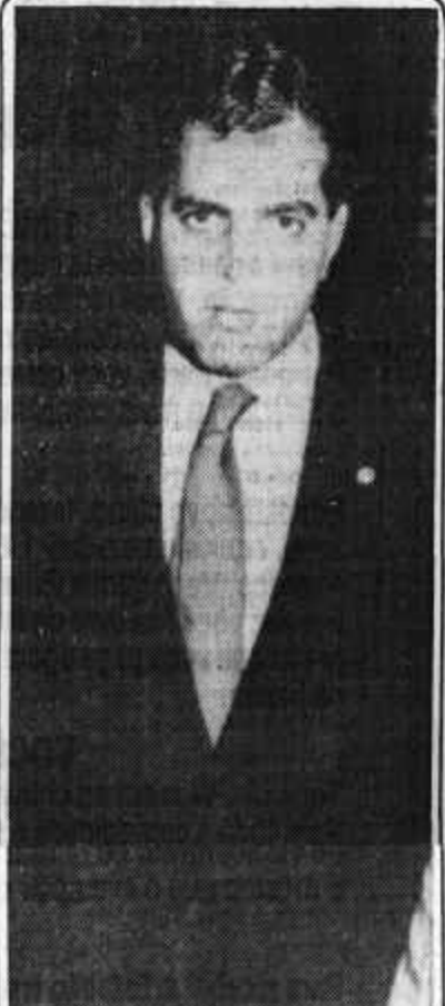
Luís Eduardo Magalhães