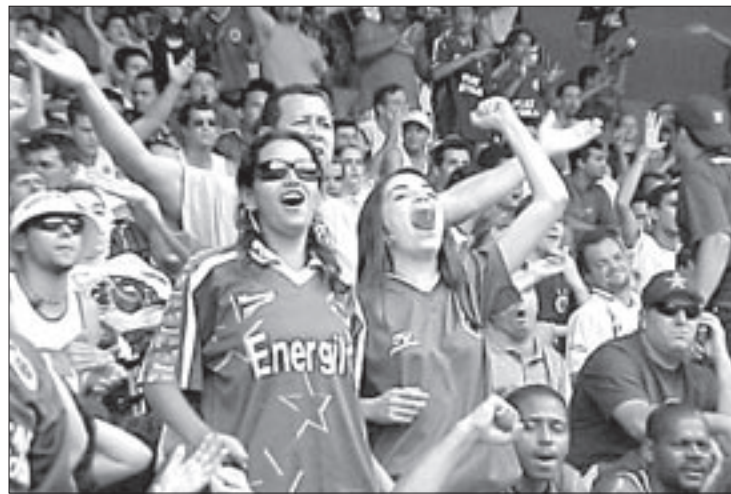
Clube com o mando de jogo e seus dirigentes são responsáveis por todos os prejuízos causados ao torcedor devido à falta de segurança

Mais segurança, informação e respeito ao público que frequenta eventos esportivos. É isso o que prevê o Estatuto de Defesa do Torcedor, em vigor desde maio de 2003, quando a Lei 10.671 foi sancionada pelo presidente Luiz Inácio Lula da Silva. A norma trouxe, entre outras novidades, a figura do ouvidor da competição, encarregado de receber queixas e sugestões contra a organização e a arbitragem. Os dirigentes esportivos também estão sujeitos a novas e mais severas penalidades. Conheça o estatuto nesta edição.