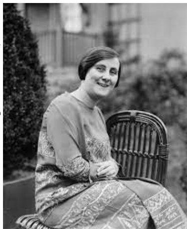
Imagem: Bertha Lutz (1894-1976)

O movimento sufragista brasileiro ganhou mais um fôlego com o retorno de Bertha Lutz da Europa, em 1918, onde se formou como Bióloga e teve contato com as sufragistas europeias. Entrou para o Museu Nacional por meio de concurso, sendo a única mulher entre dez candidatos homens. Alcançou a primeira colocação, mas teve a sua nomeação questionada por ser mulher.