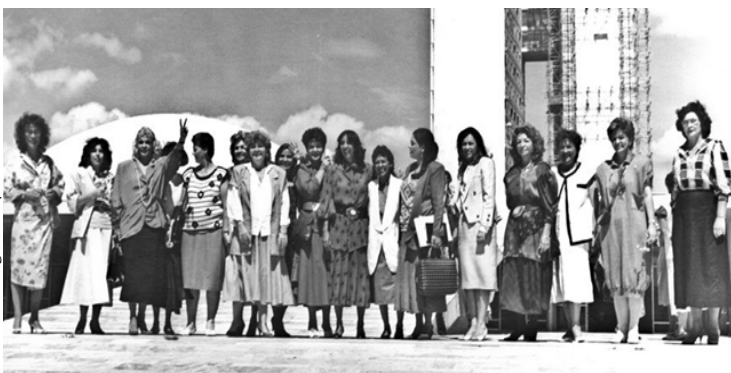
Imagem: Deputadas na Constituinte

Mais recentemente, o Supremo Tribunal Federal decidiu, na ADI 5.617/DF, que a distribuição do fundo partidário e de financiamento deve obedecer ao critério de gênero e raça das candidaturas, o que pode contribuir para um aumento de mulheres negras eleitas.