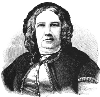
Imagem: Nísia Floresta (1810-1885)

O tema da educação era muito presente no discurso das pioneiras brasileiras que reivindicavam o direito ao sufrágio, em meados do século 19. Uma dessas expoentes era Nísia Floresta (1810-1885), educadora do Rio Grande do Norte que, contrapondo-se à ordem vigente, publica a obra Direitos das Mulheres e Injustiça dos Homens , em 1832, uma tradução livre da obra pioneira de Mary Wollstonecraft: A Vindication of the Rights of Woman (1792).