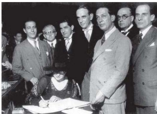
Imagem: Carlota Pereira de Queirós (1892-1982), primeira deputada federal brasileira eleita.

Por meio de pressão dos movimentos sociais de mulheres e atuação conjunta das 26 deputadas federais constituintes, as mulheres obtêm importantes avanços na Constituição Federal, entre os quais a igualdade em direitos e obrigações entre homens e mulheres.