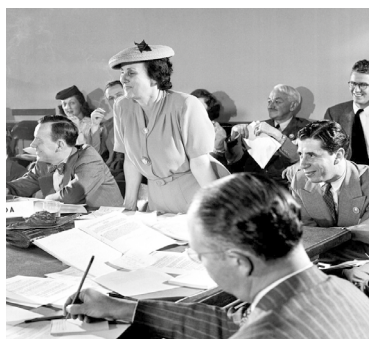
Imagem: Bertha Lutz participa de discussões na Conferência de San Francisco, em 26 de junho

Embora representando 52% do eleitorado brasileiro, as mulheres ainda são minoria na atividade política. As eleições de 2018 contaram com 31,6% de candidaturas femininas; as mulheres foram, porém, eleitas para apenas 16,2% dos cargos. No caso de governos estaduais, das 27 unidades federativas, somente em uma delas foi eleita uma governadora.