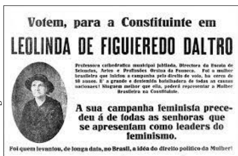
Imagem: Leolinda Daltro