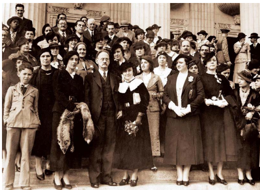
Imagem: Posse de Bertha Lutz como deputada federal

A partir da Lei 9.100/1995, é incluído o sistema de cotas na Legislação Eleitoral, obrigando os partidos políticos a inscreverem, no mínimo, 20% de mulheres nas chapas proporcionais, representando uma grande conquista feminina. A legislação, desde então, tem se aprimorado no sentido de promover e difundir a participação feminina na política, como o aumento do percentual do sistema de cotas e a utilização de recursos do fundo partidário nas candidaturas femininas, entre outras ações.