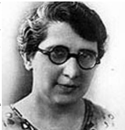
Imagem: Carlota Pereira de Queirós (1892-1982)

Ser eleita para os cargos políticos do Legislativo e Executivo logo demonstrou ser uma tarefa de altíssima complexidade, uma vez que passa, necessariamente, pela igualdade de oportunidades entre homens e mulheres nas agremiações partidárias, um desafio ainda presente nos dias atuais.