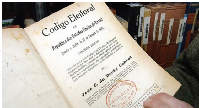
Imagem: Código Eleitoral de 1932

Diversos projetos de reforma da lei eleitoral foram apresentados, no entanto, nenhum deles foi aprovado. O projeto do senador Justo Chermont foi o que apresentou melhores perspectivas de aprovação, tendo sido acompanhado de perto pelas integrantes da Federação Brasileira pelo Progresso Feminino. Elas fizeram pressão junto aos senadores, acompanharam as sessões, apresentaram abaixo-assinado, mas, ainda assim, não lograram êxito (MARQUES, 2019).