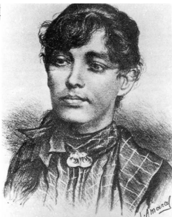
Imagem: Josefina Álvares de Azevedo (1851-1913)

Calamidade é a de termos homens como o senhor que querem aniquilar os nossos direitos em proveito da sua vaidade.