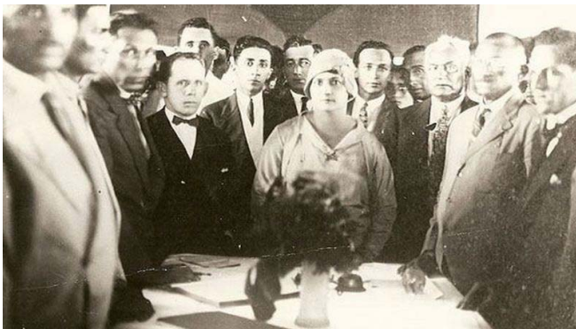
Imagem: Luíza Alzira S. de Souza (1897-1963)

No Rio Grande do Norte, é aprovado o voto feminino regional, sendo eleita a primeira prefeita da história do Brasil: Luíza Alzira Soriano de Souza 5 , no município de Lajes (RN). Foi o primeiro cargo do Poder Executivo a ser ocupado por uma mulher na América Latina. Posteriormente, os votos das mulheres foram anulados.