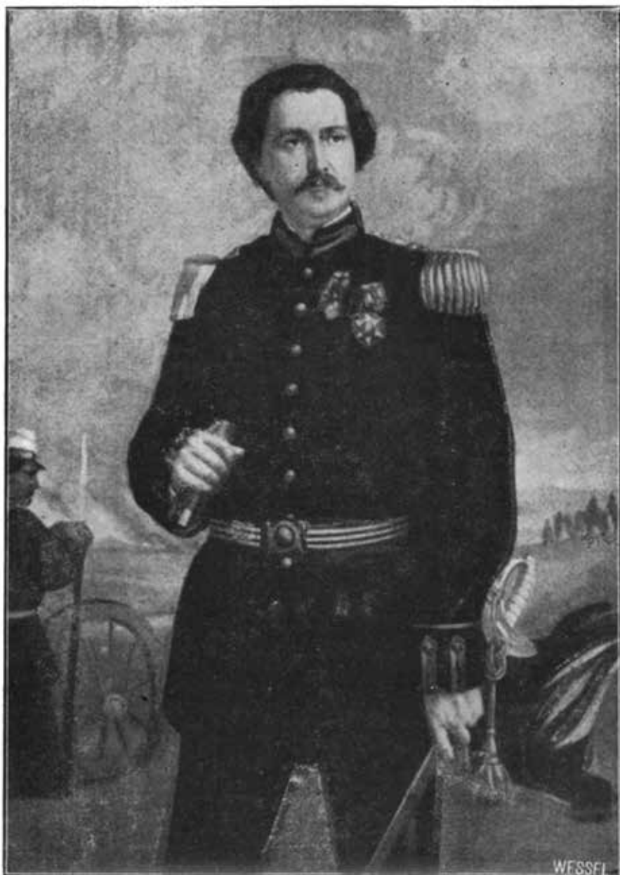
Alfredo d'Escagnolle Taunay – Visconde de Taunay Rio de Janeiro: *22 de fevereiro de 1843. † 25 de janeiro de 1899.