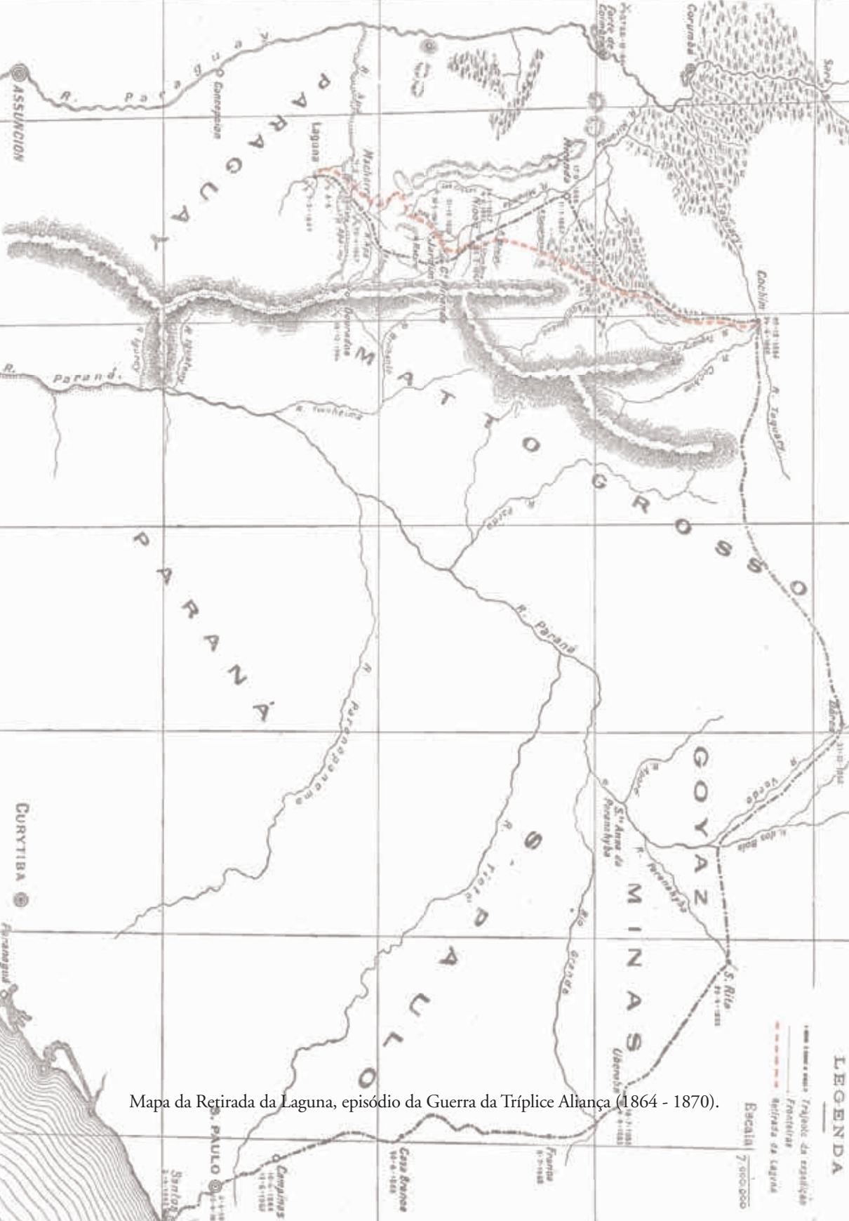
Mapa da Retirada da Laguna, episódio da Guerra da Tríplice Aliança (1864 - 1870).