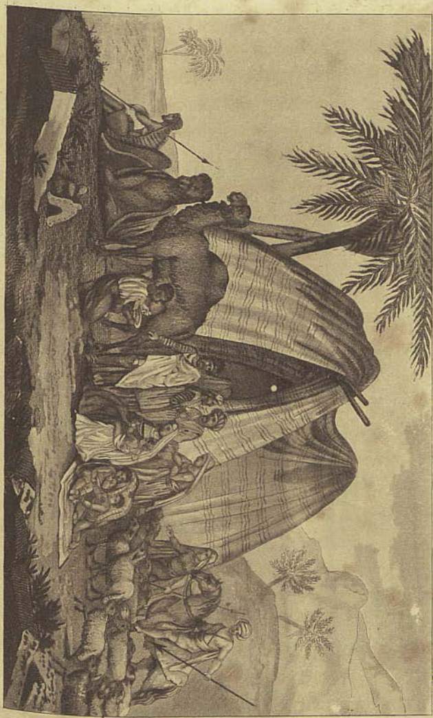
Encampment of the Indians of Barbours.