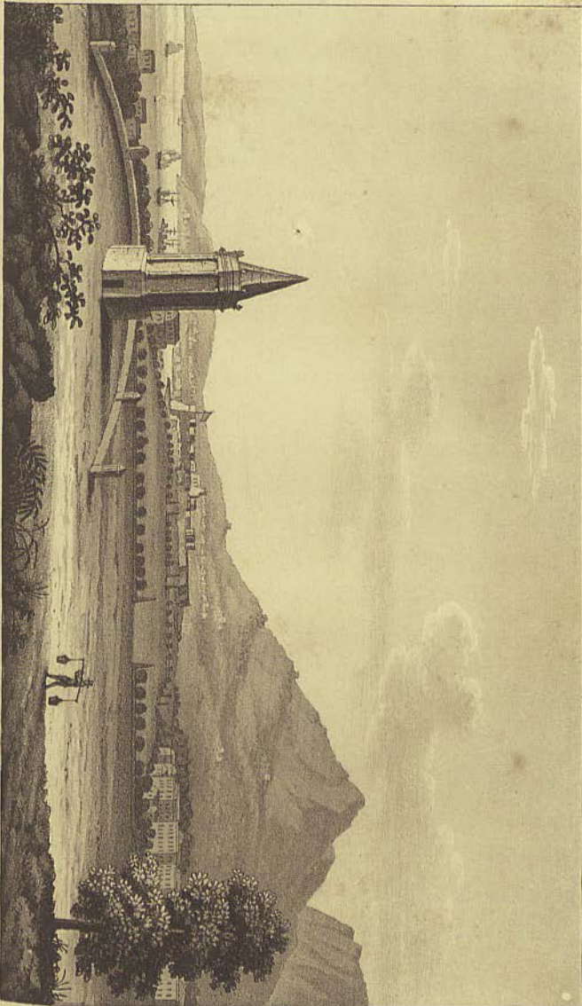
Le Cap de Bonne-Espérance.