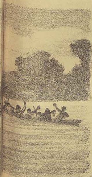
O tronco da arvore seguia o seu caminho no meio do rio sem o menor empecilho, já estava perto da queda da queda do rio.