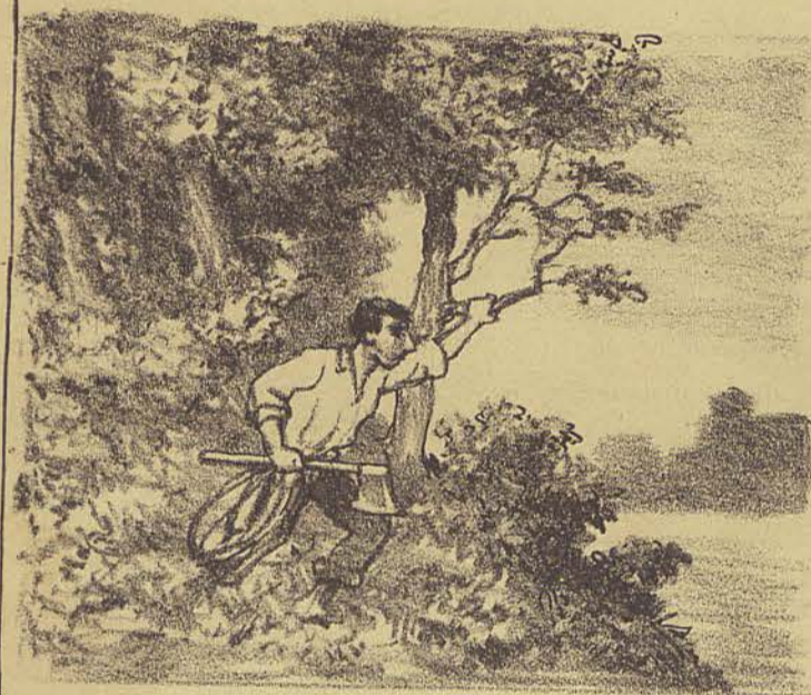
Não perdendo animo, tornou a seguir a margem do rio para tentar novo esforço: