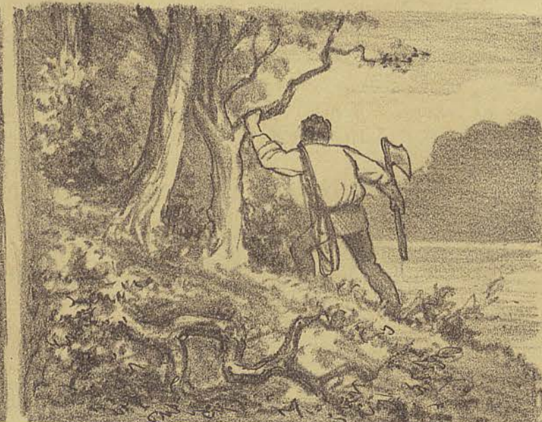
Passado o primeiro choque, Zé tomou uma resolução e continuou a seguir a margem do rio. Já que não tinha podido salvar a vida à infeliz Inayá o seu fim agora era procurar o seu corpo para salvá-lo da voracidade dos peixes ou dos urubús.