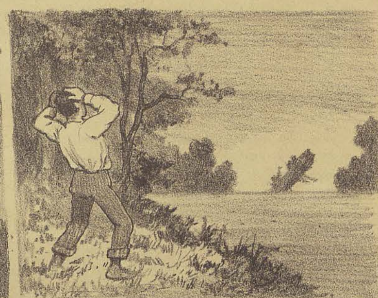
Um tremendo grito de angustia echoou de repente, repercutindo-se pelas margens do rio. Zé ergueu-se como impellido por uma mola e viu ao longe, o tronco precipitando-se no abysmo!