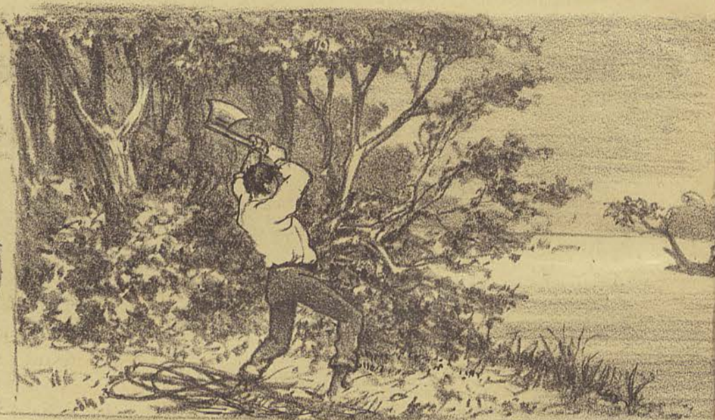
teve, porém, que parar diante de obstaculos que o obrigaram a servir-se do machado para abrir caminho, e que lhe fizeram perder um tempo precioso.