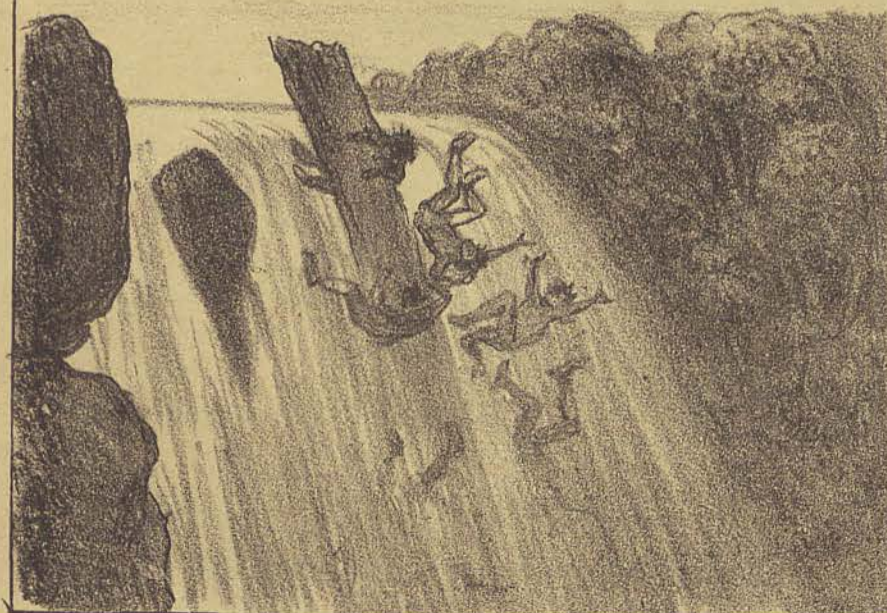
Os desgraçados que a elle se achavam seguros, foram precipitados de uma altura de mais de 40 metros, despedaçando-se os seus corpos sobre as pedras! A morte dos infelizes foi instantanea!