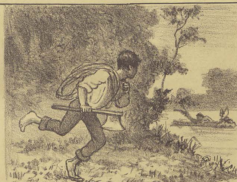
e deitou a correr pela beira do rio, seguindo com os olhos o tronco que carregava com a sua infeliz Inayá. Não perdendo animo, tornou a seguir a margem do rio para tentar novo esforço: