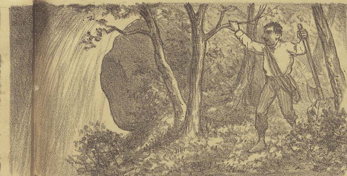
Chegando perto da cascata, Zé viu por entre as arvores a enorme massa d'agua que se despeñava com um barulho atordoador e comprehendeu o horror de uma queda em tão profundo e medonho abysmo!