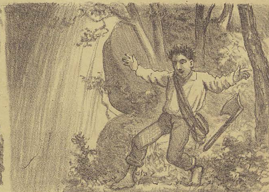
Chegando mais perto, para ver onde a cascata se precipitava, Zé estacou de repente; os seus cabellos se eriçaram, seus olhos abriram-se desmesuradamente e um grito... um grito impossivel de definir, saltou-se daquelle peito que já mal podia conter as palpitações de um coração tão angustiado!