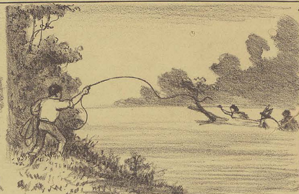
Houve uma occasião em que elle teve esperança de poder salvar-a, atirando-lhe com a corda. Infelizmente, nesse lugar o rio, era mais largo e a corda não pôde alcançá-la!