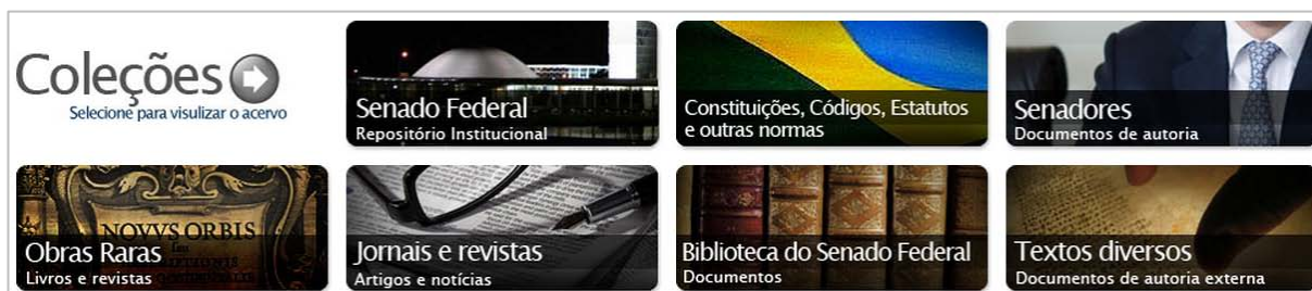
Figura 3: Distribuição das coleções

Percebeu-se que nenhum dos formatos atenderia plenamente a uma organização clara, e por isso optou-se por uma organização híbrida, com vários critérios de organização, mas que pudesse ser intuitivamente entendida pelo usuário. O acervo foi então separado em sete grandes grupos, conforme a figura 3, a seguir: