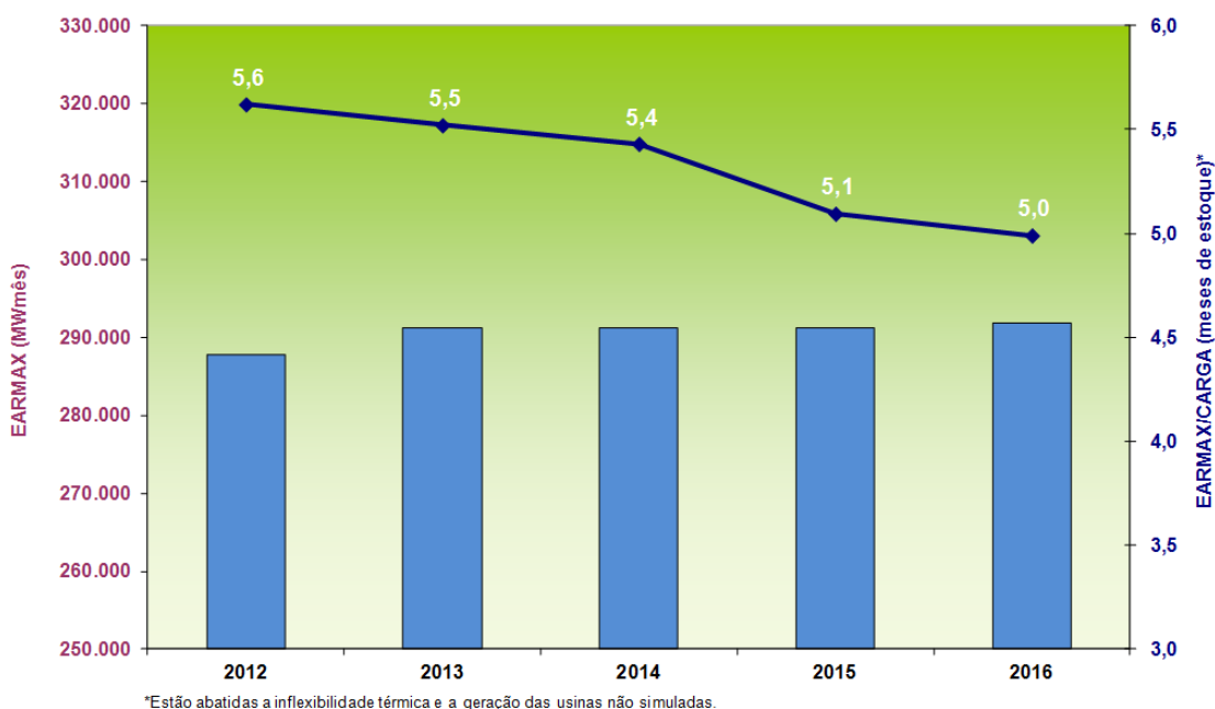
Figura 5: Relação entre Energia Armazenada Máxima e Carga do SIN (projeção 2012-2016)

Fonte: Relatório do Plano Anual da Operação Energética – PEN 2012.