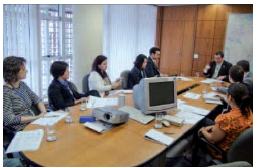
Áreas de RP e de Projetos Especiais do Senado conhecem o programa