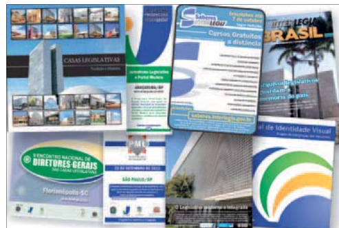
Com encontros e produtos de comunicação, Interlegis auxilia o Legislativo

atuam na área de comunicação das Casas que participam do projeto de modernização legislativa. Durante os quatro encontros de Comunicação Integrada — na Bahia, Maranhão, Rio Grande do Norte e Rio Grande do Sul —, comunicadores e parlamentares de 25 câmaras puderam tomar conhecimento do que há de mais avançado