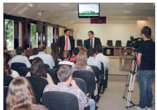
Luiz de Freitas/Senado Federal