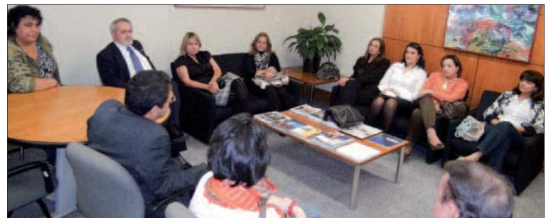
Interlegis e diretores de escolas legislativas definem ações conjuntas destinadas a servidores e parlamentares

Para os cursos a distância, o Interlegis desenvolveu o sistema Saberes, que utiliza a plataforma Moodle. Trata-se de um conjunto de softwares livres que possibilitam, por exemplo, a interação entre os participantes por meio de chats . Já os cursos presenciais são formatados a partir da demanda.