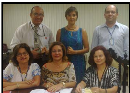
Reunião com a Biblioteca do Ministério do Trabalho, realizada no dia 19 de outubro de 2010.

Em 2010, a Gerência promoveu algumas reuniões específicas com bibliotecas da Rede, para tratar de assuntos administrativos e técnicos.