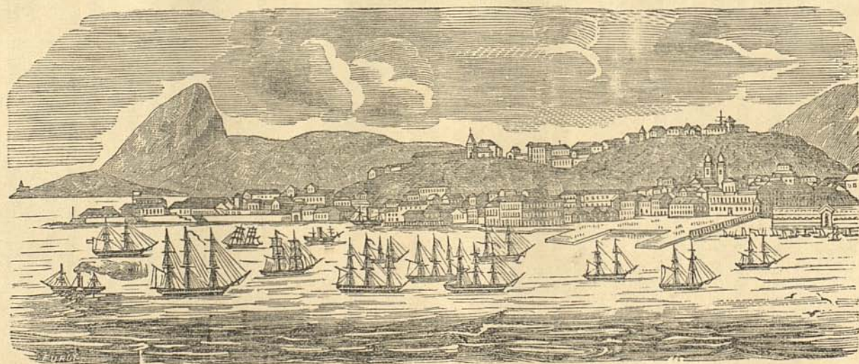
Vista do lugar de villa velha junto ao Pão de Assucar e do Morro de S. Sebastião ou castello ou primitiva