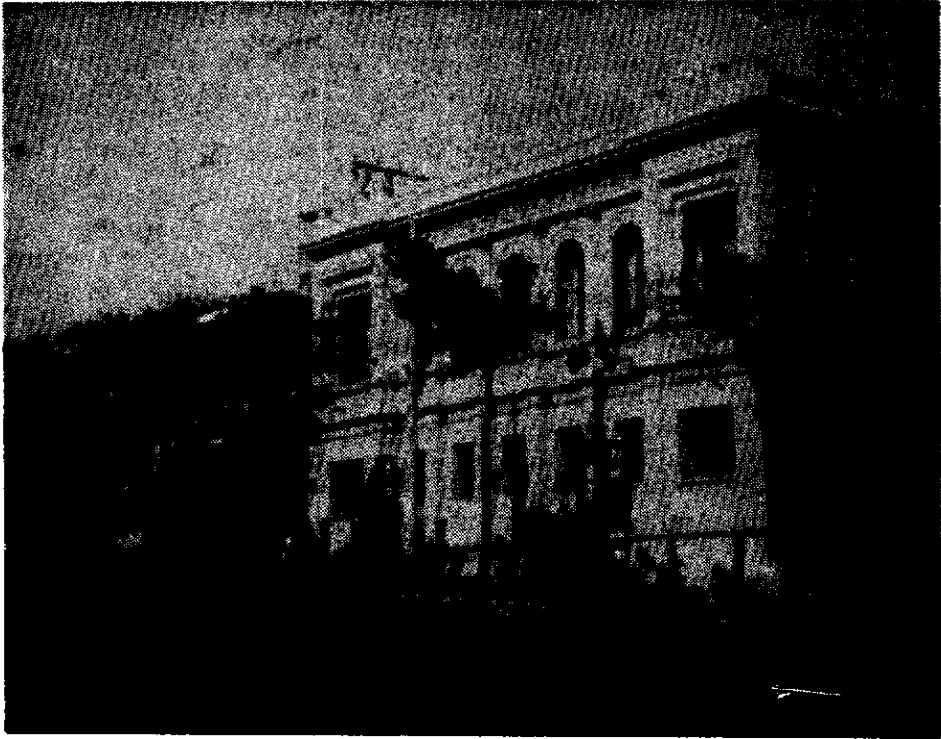
Este prédio, situado na Av. João Pinheiro, 342, em Belo Horizonte (atual Inspetoria-Geral de Finanças), foi a sede do Senado estadual, até 1930