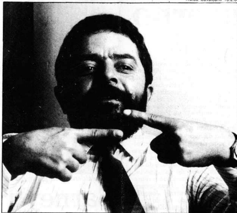
Lula acha que restrições constitucionais ao capital estrangeiro são pequenas. Medeiros, entretanto, as vê como “burras”

E acrescenta, conceitualmente: “Qualquer governo, em qualquer regime, tem o compromisso de melhorar a vida de todos os governados. A escolha do sistema econômico é um meio para se alcançar esse objetivo, não um fim. Ou o governo melhora o nível de vida de seus cidadãos, ou contraria esse compromisso. O crescimento vem da aplicação da poupança interna, complementada pela poupança externa. Vejam o Gorbachev, vejam a China, estão atraindo capitais estrangeiros. Com as restrições aprovadas, o investidor estrangeiro não vai aplicar no Brasil. Mas acredito que, com o tempo, haverá mudanças positivas. No momento, a retórica está vencendo”.